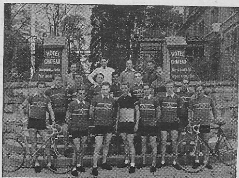
Photo de la course de vitesse à Ouchy

Membres honoraires, actifs, supporters, et passifs artisans ou commerçants, donnez-nous le nom et l'adresse de votre magasin ou de votre commerce. Nous le publierons dans un prochain bulletin afin que les membres de notre grande famille achètent et se servent chez vous.